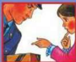
НА УЛИЦЕ ИЛИ В МЕТРО- ПОЛИЦЕЙСКОМУ