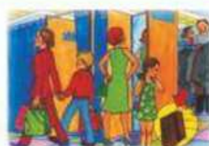
В ОБЩЕСТВЕННЫХ МЕСТАХ