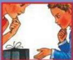
В МАГАЗИНЕ- ПРОДАВЦУ