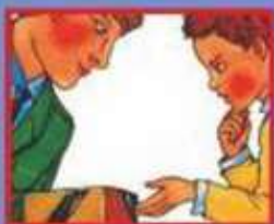
В ТРАНСПОРТЕ- ВОДИТЕЛЮ