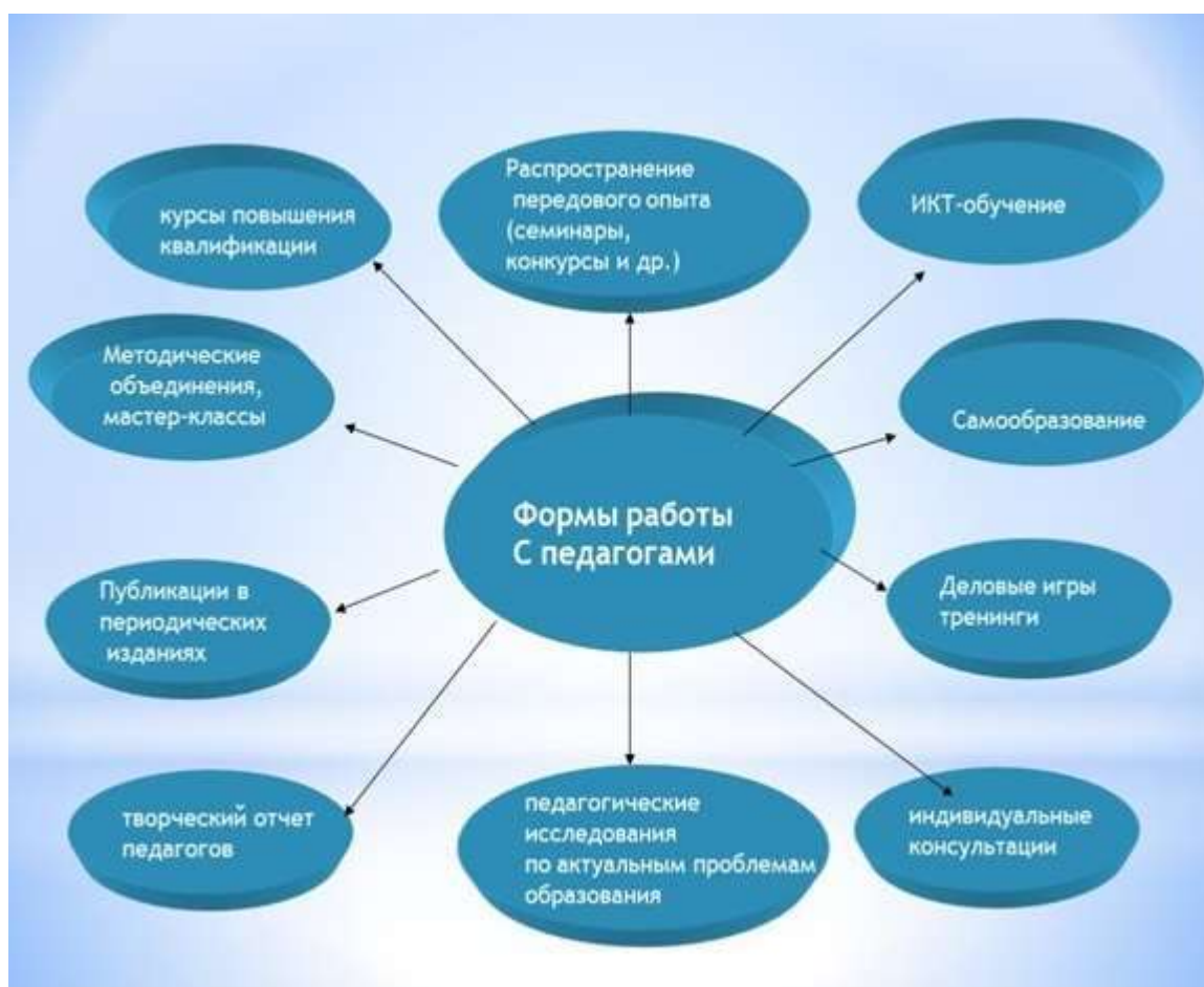
Рис. Формы работы с педагогами

Основными формами методической работы с учителями-предметниками, классными руководителями, воспитателями, педагогами дополнительного образования, др.) являются: